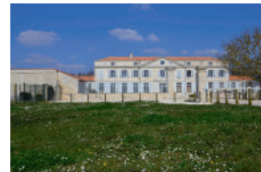
Château de La Tourfillère