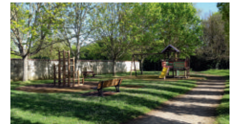
Espace jeux enfants