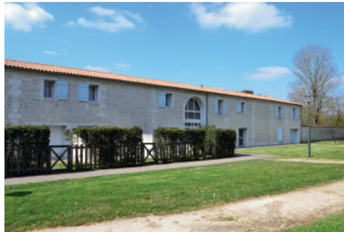
Les gîtes de La Tourfillère