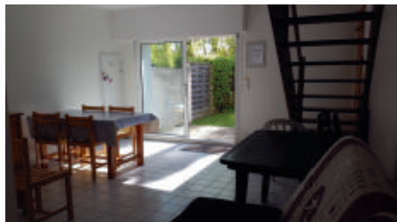
Intérieur du gîte 5 personnes