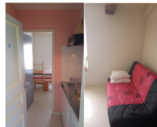
Intérieur du studio 2 personnes